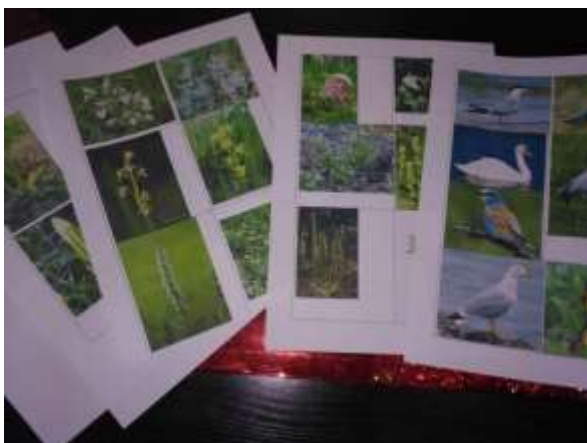
Сбор, редактирование и распечатка информации.