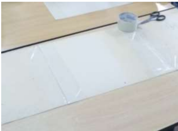
Склеивание картонных страниц.