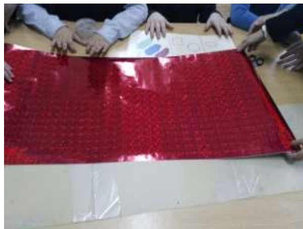
Оклеивание красной бумагой.